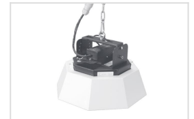
HB.S 120 met externe reflector