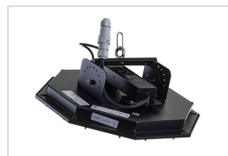
HB.M 250 bovenaanzicht