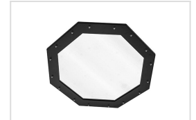
HB.M 250 microprismatisch