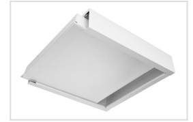
LAB 596x596mm montage in opbouwframe (optioneel)

Inbouwarmatuur geschikt voor inlegplafonds 600x600 en 300x120, volledig IP65. Basis uit wit gelakte staalplaat, voorzien van acrylaat opaal diffuser. Uitermate geschikt voor vochtige ruimtes.