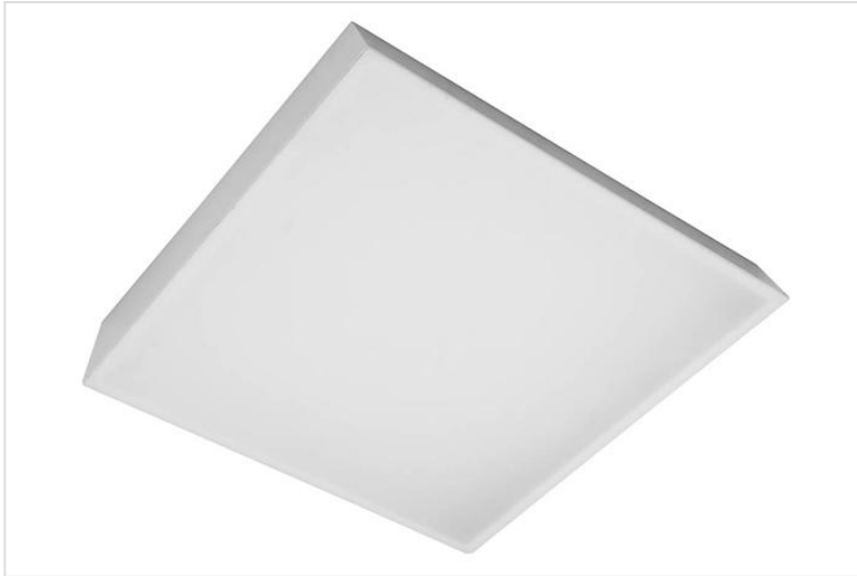
LAB 596x596mm opaal