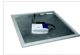
Q.LED 596x596 bovenzijde

LED paneel met aluminium kader. Licht doorlatend acrylaat lichtvlak met een uitermate hoge gelijkmatigheid. Beschikbaar voor inlegplafonds 300x300, 300x600, 600x600, 300x1200, 600x1200 of 300x1500. Vlakke montage tegen plafond met behulp van magneten mogelijk (QMAG), er dient in het plafond plaats voorzien te worden voor de driver. Alle versies zijn geschikt voor pendelmontage (QLEDP). Ook geschikt voor inbouw- en opbouwframe (FRAME...).