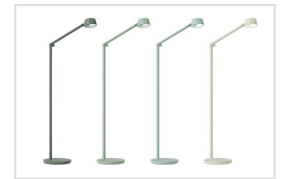
Motus Floor 2