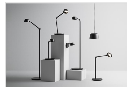
Motus familie: Motus Floor / Mini / Table / Wall / Pendant / Flat