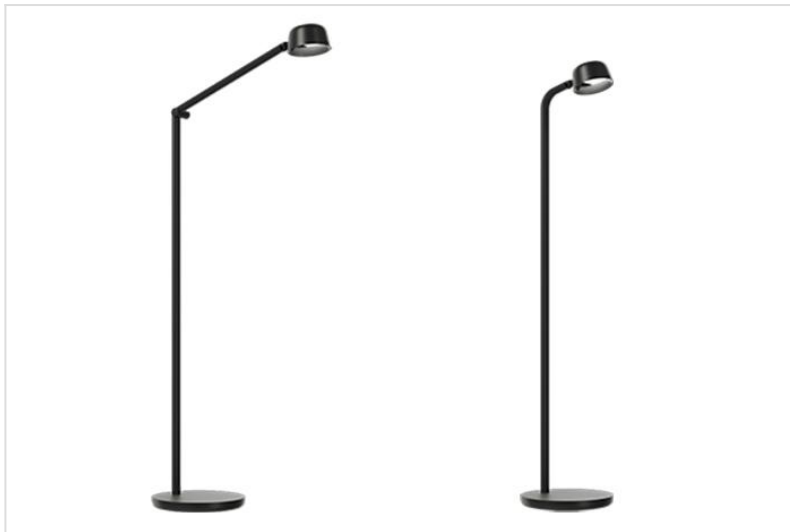
Motus Floor 2 / Motus Floor 1