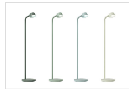
Motus Floor 1