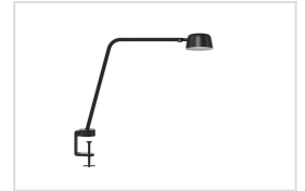
Motus Table met tafelklem (CLAMP)