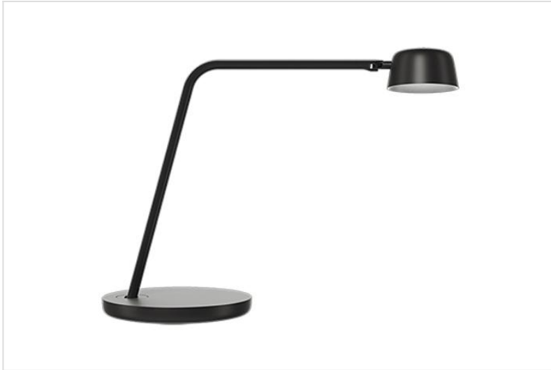
Motus Table met tafelbasis (BASE)

Met drie ingenieuze bewegingsmanieren kunt u het lamphoofd van Motus Table vloeiend op de gewenste plek richten en zo het licht plaatsen waar het nodig is. Deze veelzijdige bureaulamp heeft een vaste arm met één scharnier in de basis en één bij het lamphoofd.