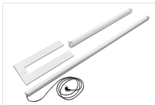
Stan onderdelen - compleet geleverd