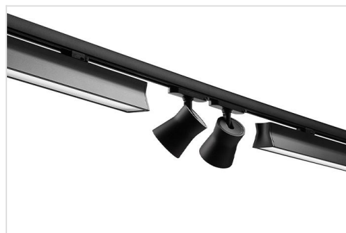
Runway L in combinatie met Runway S