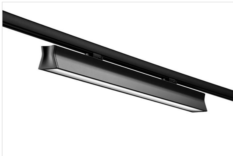
Runway microprismatisch - zwart

Lineair armatuur geschikt voor de meest gangbare 3-fase trackrails (EUTRAC, GLOBAL). Behuizing van gegoten aluminium afgewerkt met witte of zwarte poedercoating. Voorzien van microprismatische diffuser (MP) of dubbel parabolische reflector (DP).