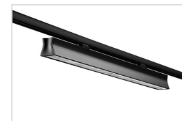
Runway met dubbel parabolische reflector - zwart