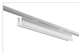
Runway met dubbel parabolische reflector - wit