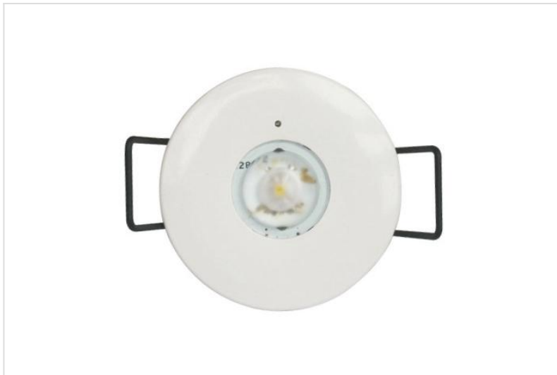
SOS eye Wide Beam