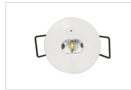
SOS eye Corridor

Niet permanente noodverlichting conform EN 60598-2-22. Geschikt als vluchtweg- en veiligheidsverlichting. Beschikbaar met breedstralende optiek (Wide Beam), of met lens voor gangen (Corridor). Voorzien van zelftest functie. Geschikt voor omgevingstemperatuur van 0 tot 55°C. Voorzien van beveiliging tegen overlading en ontlading.