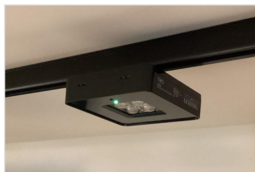
Spectra noodverlichting voor montage op 3-fase rail