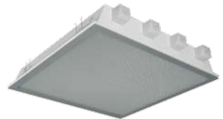
IP54 (alleen onderzijde)